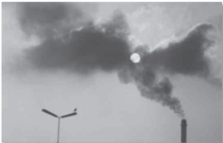
Verontrusting over luchtverontreiniging

Vlaardingen, 14 april 1964, Aan de Ministerraad.