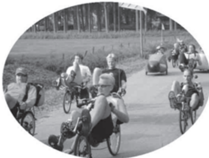
Na 2015 werd de ligfiets steeds populairder

Zo rond 2015 was autorijden voor de meeste mensen onbetaalbaar geworden. Delen van snelwegen werden daarom bestemd voor fietsers en voor voertuigen die met duurzame energie opgeladen konden worden. Verlenging en verbreding van snelwegen was uiteraard niet meer nodig. In 2017 bleek uit metingen van de milieudienst dat de lucht in het Rijnmondgebied schoner was dan ooit.