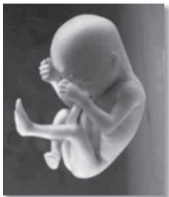
Het ongeboren kind