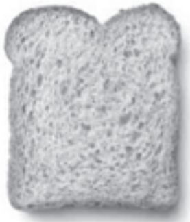
Brood bevat jodium

Stichting Milieu Dichterbij tracht in haar projecten bijzondere aandacht te besteden aan de relatie tussen gezondheid en milieufactoren. In de Megafoon worden onderwerpen belicht vanuit het landelijke netwerk Gezondheid en Milieu.