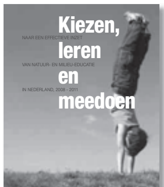
Meedoen aan natuur- en milieueducatie

Naar een effectieve inzet van natuur- en milieueducatie in Nederland, 2008-2011