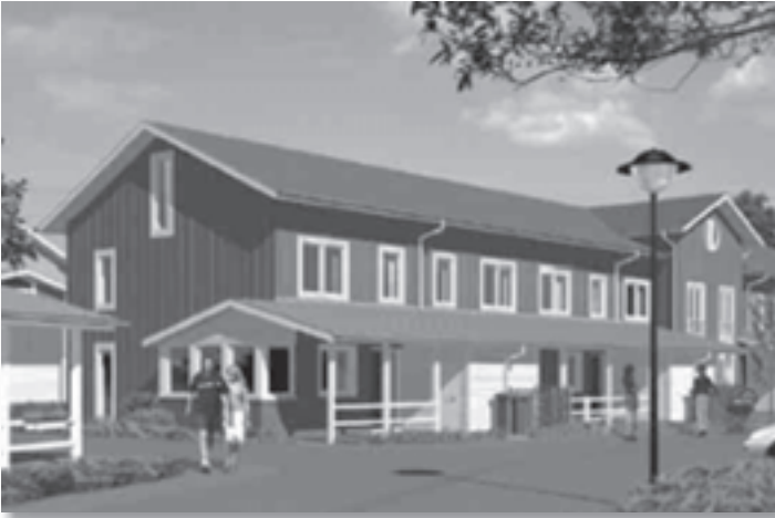
Voor het 'natuurlijk' wonen worden 170 bomen gekapt

Onlangs heeft de gemeente Schiedam een vergunning afgegeven voor het kappen van 170 bomen in verband met de aanleg van een fietspad en ruiterspad in het bosgebied ten noorden van Sveaparken Schiedam. Er bestaat een herplantplicht van 130 bomen (waar is nog onbekend). De VTM heeft bezwaar aangetekend.