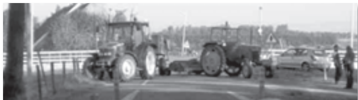
Boerenbarricade op 20 september 2008

Acht jaar lang heb ik geluisterd, gepraat als Brugman en bovenal de deur wagenwijd open gehouden. De polders van Albrandswaard. Door een deal van de Rotterdamse haven met verschillende milieu groeperingen is het verlies aan natuur door de komst van de 2e Maasvlakte gecompenseerd door het opofferen van polderlandschap naar de echte gecultiveerde robuuste natuur. Als boer betekent dit, op dat moment, over en uit met de agrarische activiteiten.