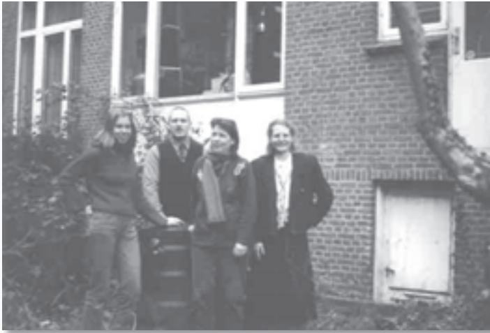
Oud VTM-medewerkers aan het W.G. Burgerplein