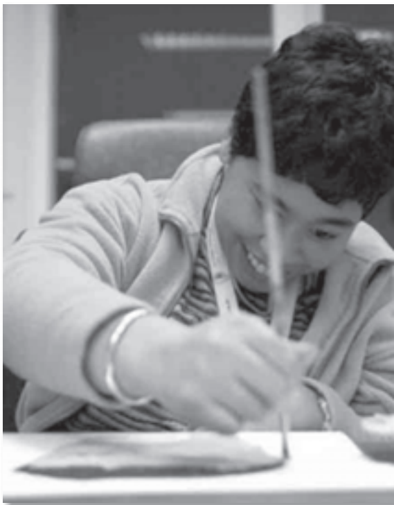
Kras-kunstenaar aan het werk

De SMD voert ook in 2009 interessante nieuwe projecten uit. Het idee is ontstaan om een breed maatschappelijk project uit te voeren waarbij milieu, kunst en integratie van mensen met een verstandelijke beperking samenkomen. Dit project wordt opgezet met Stras (Stichting Rotterdamse Avondschool) ( www.stras.nl ). De kunsttak van de avondschool (KRAS) zal deelnemen aan het project. Het project krijgt de werktitel 'Er zit meer in afval', waarbij de